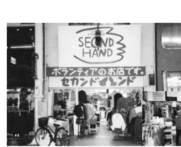
1994年9月30日、セカンドハンド田町店！