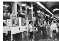
なぜか、高知で活動報告＆写真展を開く。