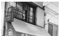
瓦町店オープン前の改装。'99年～01年は引っ越し＆改装作業の連続。