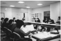
2000年、NPO法人設立総会。特定非営利活動法人化。

▼各地で開催するイベント。しばらくご無沙汰していたボランティアさんが来場し、気がつけば受付やレジに自然と入っていて、はっと驚かされる。何年ぶりであっても、反射的に体が動くのだろうか。この働き者&ボランティア精神がセカンドハンドを支えるパワーの源。▼当初はカンボジアに本を贈るために周囲の力を借りながらやれるところまで、と一人で始めた活動。やれるところまで…が、ず～っと続いた理由が支える皆さんの存在。このニュースレターを読んでいるあなたもその一人。気付けばひとりじゃなく、多くの人が集まる「組織」に。無償で場所を借り、転々とし続けることに限界を感じ、本部ビルを競売物件で見つけて購入。私たちに課題はあるが、日本の制度にもまだまだ問題あり。社会をよりよくするため、まじめに取り組む人たちの活動が報われる制度整備を！▼支部が全国にある理由をよく聞かれる。確実な活動をするために無理に拡げないという方針だが、じゃあなぜ広がっているのか？多くはもともと高松でボランティア参加していた人が引っ越して、そこでも何かしたいと思い、自分のできる範囲で活動の種をまいたのが始まり。全国放送や新聞を見て活動を始めた人も。そこでも、活動は一人から始まっています。▼東日本大震災の被災地支援では林田物流さん（坂出）が無償でトラックを出して下さった。援助物資を乗せたトラックの助手席に同乗し石巻へ。このような協力も様々な会社からいただいている。皆さんに感謝！