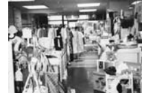
セカンドハンド岡山店（1996年～2000年、支部は2002年）