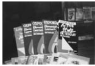
シェムリアップ教員養成大学に寄贈した辞書。