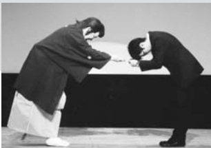
南ファミリー劇団様より、寄付金の贈呈