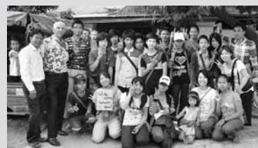
奨学生のみんなと