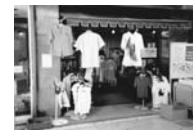
セカンドハンド丸亀店（1997年～）