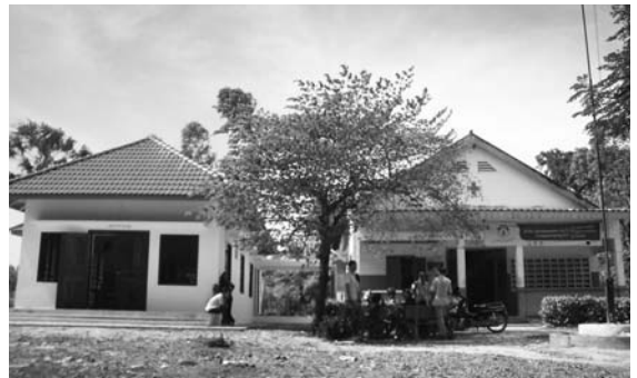
セカンドハンドが支援して建てたスヴァイリエンのお産病棟(左)

セカンドハンドはこれまで、カンボジアにおいて、公立診療所やお産病棟の建設といったハードの支援、そして救急隊育成、救急・保健医療に関するワークショップや研修の実施といったソフトの支援などを行ってきました。今回の新しいプロジェクトの実施場所であるスヴァイリエン州においても、学校建設支援、職業訓練支援、お産病棟の建設(セカンドハンド通信NO.63参照)を行ってきました。このように協力関係にあったスヴァイリエン州保健局と協議する中、「救急医療の強化のために協力してほしい」、「工場でも応急処置のワーク