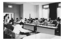
1998年4月12日、セカンドハンドとしては、第一回となる総会を開催。