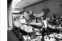
独自のバザーでは4tトラック3車分ほどの荷物を搬入（写真左：2005年頃、JR高松駅横にて、写真右：2006年頃、丸亀町レッツホールにて）