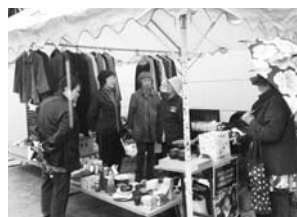
草ヶ江幼稚園でのフリーマーケット。雨の中、お立ち寄りいただいた皆様、ありがとうございました。

昨年11月3日の草ヶ江幼稚園でのフリーマーケットは、あいにくの雨でお客様の出だしも今一つでしたが、常連の方々は提供品を持って来店してくださり、心強く、またありがとうございました。新年は1月20日から。今年もよろしく願います。