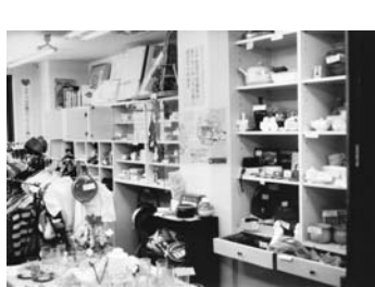
1994年5月27日、セカンドハンド1号店が高松市南新町にオープン！3か月限定、家賃無料！（1994年7月27日撮影）