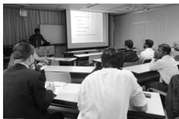
研修の学びを共有