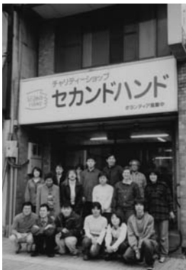
2001年、高松店がオープン。同ビルの3階が本部事務所。

2001年、高松店がオープン。同ビルの3階が本部事務所。セカンドハンドの歴史を振り返ると、人って無力じゃない、動けば何かできる、変わるって、改めて感じるそれがセカンドハンドの魅力。たまに思うこと。「ニュースレターがきれいになった！進化？」「HP ができた！」でも、値札は変わらない（笑）。郵便物が「高知県高松市」で届くことがあるが、うち「香川県」…。カンボジア事業でのびっくり。その1…支援した小学校の開校式が3月1日に予定されていたのに急に2日に変更と連絡あり。首相が臨席されるが、28 日まで外遊で間に合わないそう。後で聞いたら、秘書が2月も31日までであると思っていたとか！？その2…カンボジアから郵送された書類がなかなか届かない。1か月後に「アドレス間違えてました」と再送され無事到着。最初に書いた宛先はメールアドレスだったそう。ある日、警察から朝 6 時頃に「お宅のお店に不審者が」と電話があり、慌てて向かっていたら当時の職員 F さんから「不審者、私です」と電話あり。早く仕事を覚えようと、朝早く出勤し、過去の資料に全部目を通していたそうで、仕事熱心な姿勢には驚いた。セカンドハンドの職員は少ない人数で多くの仕事をこなすスーパースタッフ。大変な仕事だが、いつもにこやかに、かつ機敏に対応する姿勢にボランティアの皆さんも「支えてあげたい」と思ってくれているよう。セカンドハンドは職員を選ぶときに「人柄」を一番重視する。なので、素敵でとてもいい人たちが、面白い、いわゆる天然系も多く、常に笑いを巻き起こしてくれる存在も。それが面白くて人が集まってくるのかも。無いのが当たり前とことん節約精神のセカンドハンド。夏になれば汗疹が出来、冬になれば指がかじかんだ。エアコンや棚、運搬車、何でも欲しいものはもらえるまで待つ。いただきものばかりの事務所は、棚や机ファイルまでもが不揃い不便もあるけど、節約した分支援に充てられると思うと大切な精神。でも、ある物も節約するのがセカンドハンド流。入ったばかりの頃、セロテープ使うときに「1cm！」と先輩に教えられて正直びっくりした～。