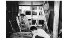
田町時代の事務所の様子（1999年当時）