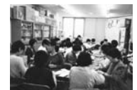
ある郵便局の2階で行っていた「セカンドハンド通信」発送作業。たくさんボランティアの手作業により、皆さんに届けています！