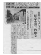
1995年、1校舎目、トマイ小学校校舎完成。