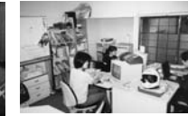
2000年、NPO法人設立総会。特定非営利活動法人化。