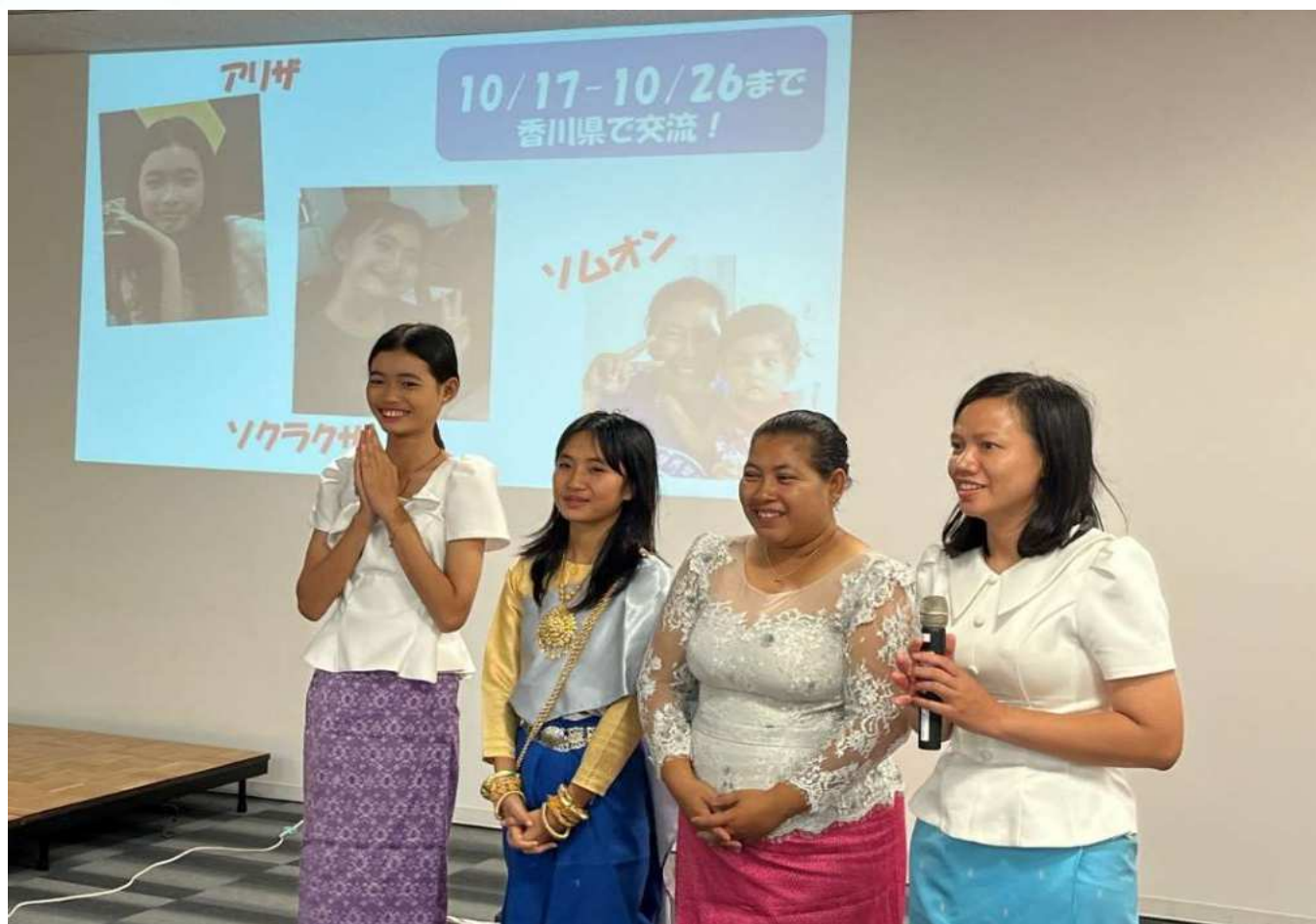
スタッフの交代のため、119号は仮のデザインで作成しています。

セカンドハンドに関わる皆様や香川県内の皆様にカンボジアのことを知ってもらうだけでなく、カンボジアの子どもたちにとっても、日本文化や香川県、セカンドハンドのことを知ってもらう良い機会となりました。詳細は P2、P3 にて紹介します！