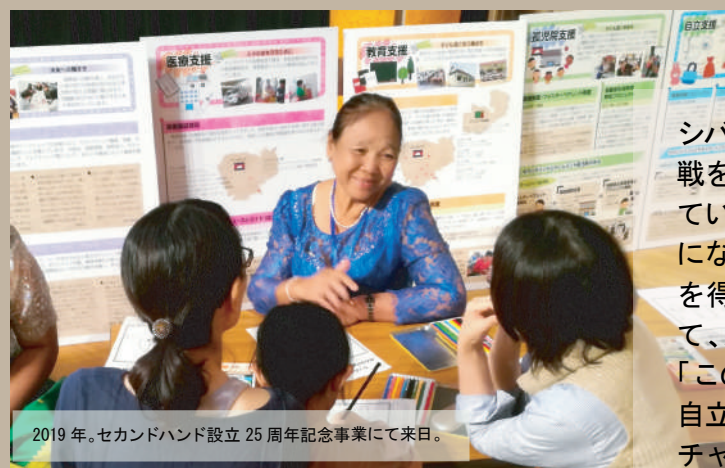
2019年。セカンドハンド設立25周年記念事業にて来日。

この突然の訃報に接し、私たちも深い悲しみに包まれています。3月に自宅兼工房にて、いつもの笑顔で迎えてくださったばかりでした。